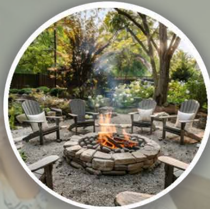
Área de fogata