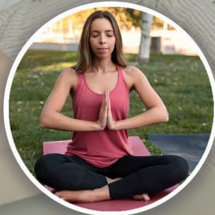
Área de meditación